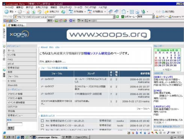
図 3 XOOPS

りますが最近ようやく形になり始め、研究会のメンバーに使ってもらい始めています。現在は、XOOPSは様々なモジュールを組み合わせることで機能が追加できるのでメンバーの要望や意見を聞きながら使いやすいページを目指しています。今後は学内だけでなく、外からもアクセスできるようにする予定です。(04JK112 中村尚香)