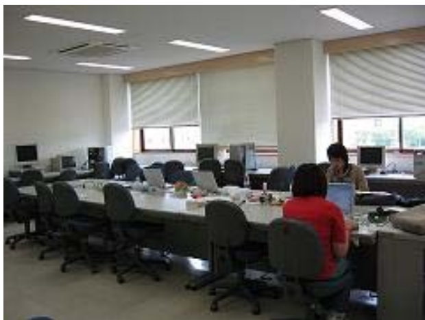
図 2 実験室 室内