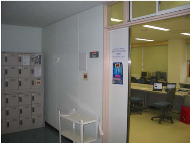
図 1 12 号館 3 F 情報システム研究会実験室 (ロッカーの横が入口)

情報システム研究会は、平成 15 年度に、学生と教員による研究グループとして発足しました。メールでのオンラインディスカッションや 12 号館 3 階の実験室での活動やミーティングを行っています。