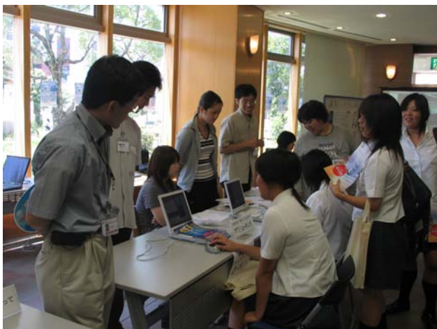
図 6 オープンキャンパス

18 年 7 月のオープンキャンパスでは、情報システム研究会の活動内容の展示も行いました。各プロジェクトの紹介や成果物の展示などを行ったところ計 44 名の見学があり、たいへん賑わいました。