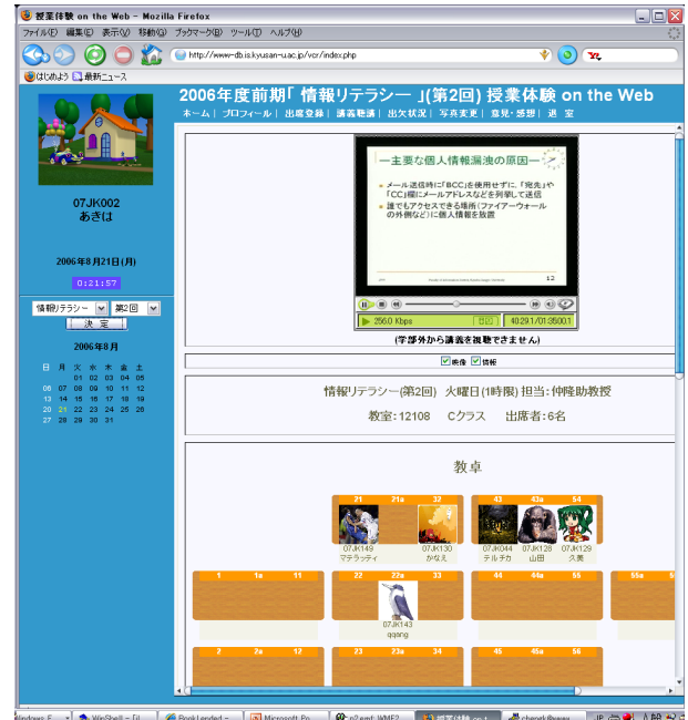
図 1 高校生向けの授業体験 on the Web システム

このシステムは九州産業大学情報科学部で 4 年間運用してきた講義記録システムに録画されている映像データを利用し、ウェブでの出席登録、座席レイアウト確認がで