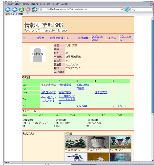
図 3 履修支援ソーシャルネットワーク

学生から提案があり教員の意見を加えたテーマの一つは「ソーシャルネットワークによる履修支援」である。学